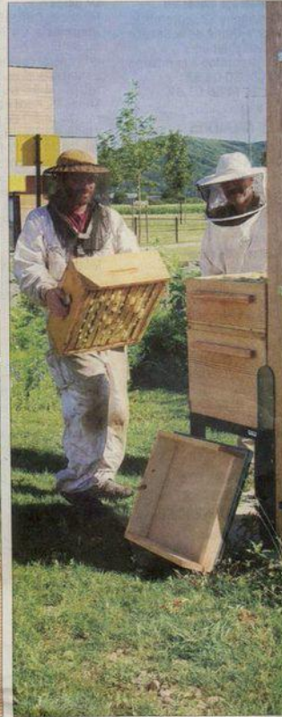
Tous les rayons de la ruche étaient bien remplis de miel. L'enfumage des abeilles permet de travailler plus sereinement.